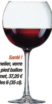
Santé ! Chef & Sommelier, verre à pied ballon Cabemet, 37,20 € les 6 (35 cl).