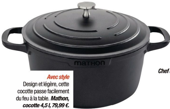
Avec style Design et légère, cette cocotte passe facilement du feu à la table. Mathon, cocotte 4,5 l, 79,99 €.