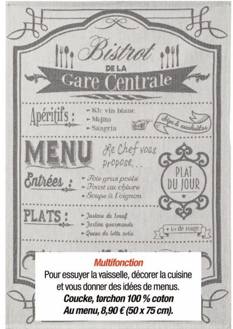
Multifonction Pour essuyer la vaisselle, décorer la cuisine et vous donner des idées de menus. Coucke, torchon 100 % coton Au menu, 8,90 € (50 x 75 cm).