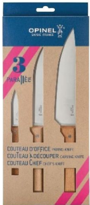
Comme les chefs Ce set réunit les trois couteaux indispensables en cuisine. Opinel, coffret Trio Parallèle, 60 €.