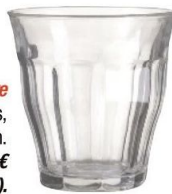
À boire Ces verres, petits ou grands, s'utilisent au quotidien. Hema, verre Picardie, 1,25 € (25 cl) ou 2 € (50 cl).