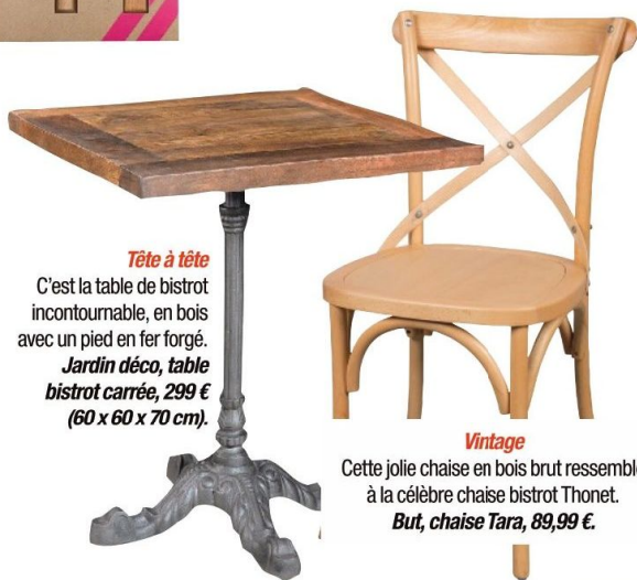
Tête à tête C'est la table de bistrot incontournable, en bois avec un pied en fer forgé. Jardin déco, table bistrot carrée, 299 € (60 x 60 x 70 cm).