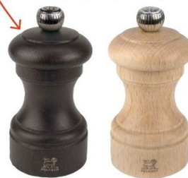
Sel et poivre Ce duo de moulins à poivre et à sel est un incontournable des tables de bistrot. Peugeot Saveurs, Duo Bistrot, 44,90 € (h. 10 cm).