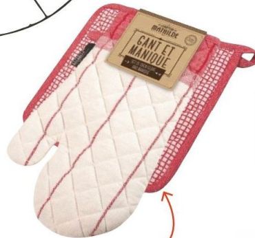
Chaud devant Les motifs emblématiques des bistrots s'invitent sur ce gant de four en coton. Le Comptoir de Mathilde, set gant et manique, 9,99 €.