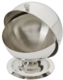
À l'ancienne Un sucre dans votre café ? Mathon, sucrier boule Bistrot, 16,99 €.