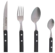
Sortez les couverts Jean Dubost, couverts Les Bistrots à la française, à partir de 4,80 € la pièce.